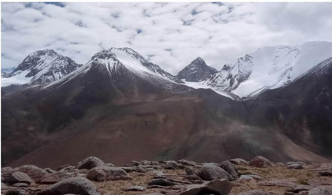
インド北西部のMerak峰(6,481m)