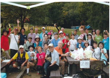
5年振りの「芋煮会」 やまびこ山想会

毎年秋の恒例行事「芋煮会」を9月29日、5年振りに開催しました。会場は天白公園のデイキャンプ場で、ここは例